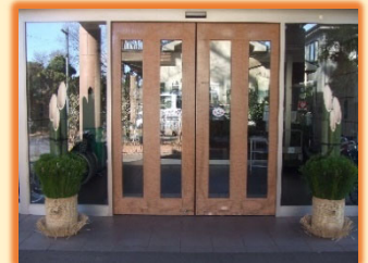
エントランスの門松